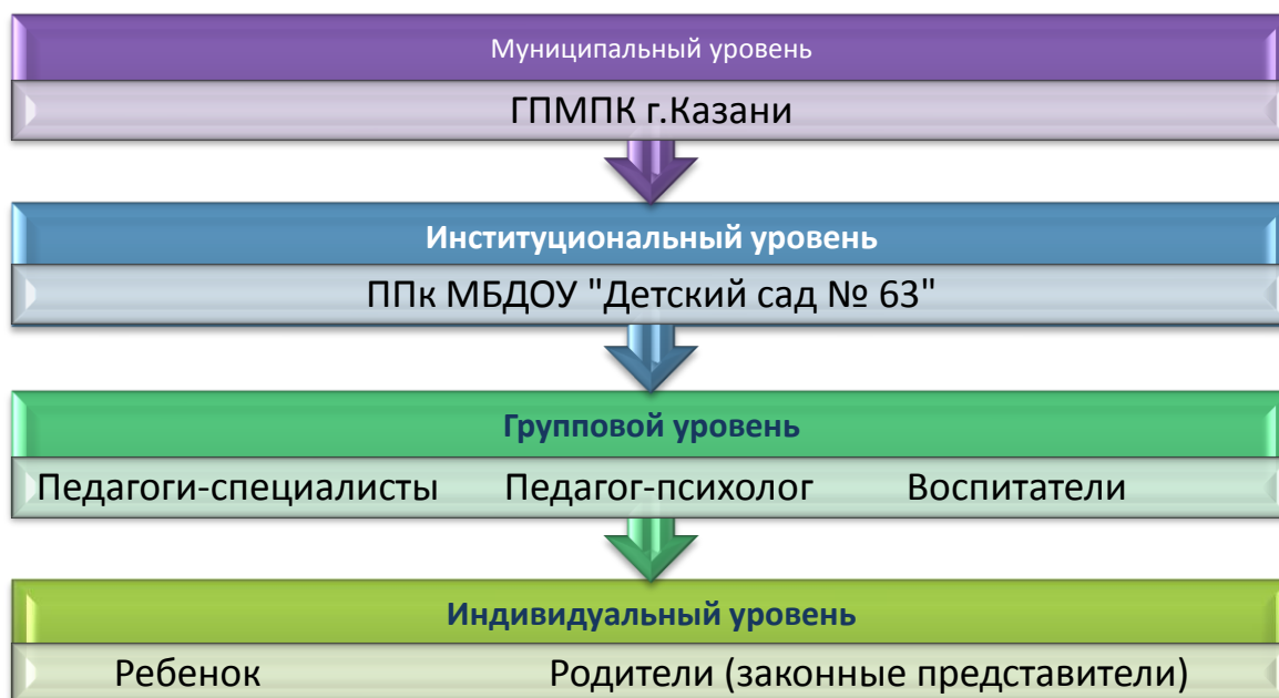
Схема взаимодействия по вертикали

• ГПМПК – городская психолого-медико-педагогическая комиссия выступает в данной модели как структура, обеспечивающая своевременное выявление детей с особенностями в физическом и (или) психическом развитии и (или) отклонениями в поведении, организация и проведение их комплексного психолого-медико-педагогического обследования и подготовка по результатам обследования рекомендаций по оказанию им психолого-медико-педагогической помощи и организации их обучения и воспитания, а также подтверждение, уточнение или изменение ранее данных рекомендаций;